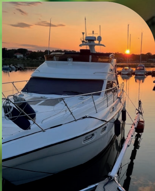
Timmernabben har jättefina stränder och en bra camping med roliga aktiviteter för barn och vuxna plus ett fint fiskerökeri. / Felix Ainali, trafikassistent, särskilda persontransporter