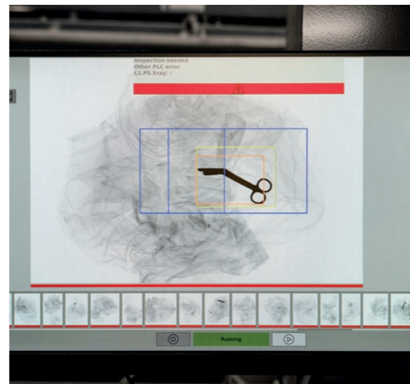
Alla arbetskläder går genom en röntgenmaskin, en investering som infördes 2024 eftersom personalen fick stickskador av vassa föremål. Här visar röntgenbilden en sax.