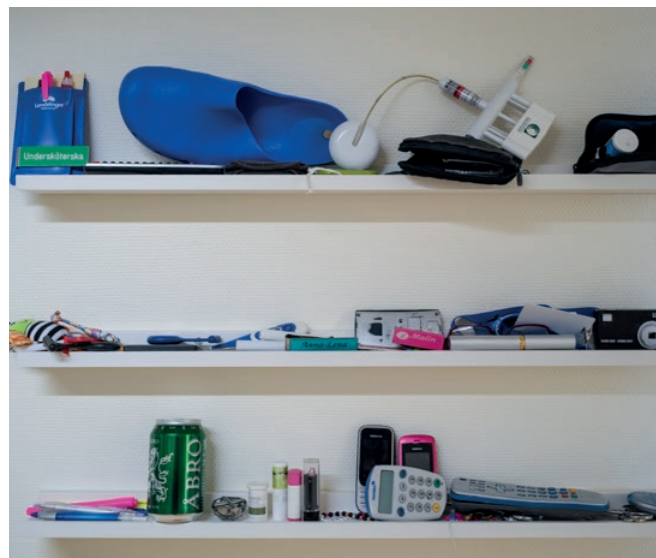
Hyllorna på tvätteriet har med tiden kommit att likna ett litet museum, fyllt av upphittade och ovanliga föremål som följt med smutsvätten.